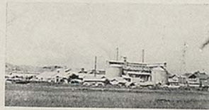
磐城セメント (四合町)