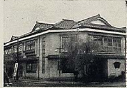
扇屋 平市紺屋町 電 165