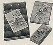
「いわきまんじゅう・志お屋崎」 開花亭・5丁目 電342