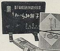
「たいら餅」 東京堂・才橋小路 電 1108