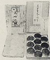
「あやめ餅・尼子まんじゅう」 第2平製パン 才橋小路・電 21・327