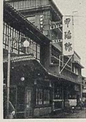
甲陽館 平市田町 電 一八一四八