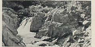
夏井川溪谷 (小川町)