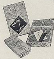
「じやんがら・くろ梅」 みよし 田町・電691 売店 銀座街