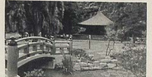
国宝白水阿彌陀堂 (内郷市)