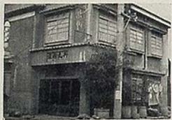
丸丹旅館 平市南町 電 944