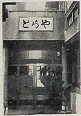
とらや 平市田町 電 六四八