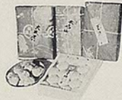
「氷石山・ゴルフ」 大木屋 南町郵便局裏 電1609