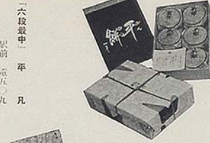
「六段最中」平 駅前 電五〇九