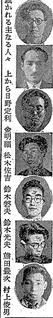
裁かれる主なる人々

平事件に関連した自放浪者の居所が判明した。これは、戦後の社会状況を反映している。この公判は、戦後日本の歴史を刻みつけたもので、現在の勢力が渦巻いている。この公判は、戦後日本の歴史を刻みつけたもので、現在の勢力が渦巻いている。