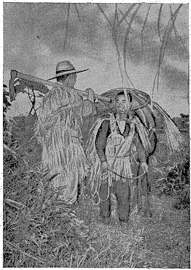
港内に二大埠頭を築く計画が...