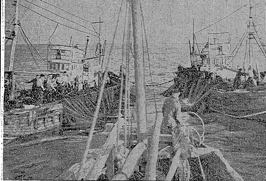
写真 上は掛罾も勇しく網上げを始めた揚繰船 下は甲板に溢れた海の米、イワシの水揚げ