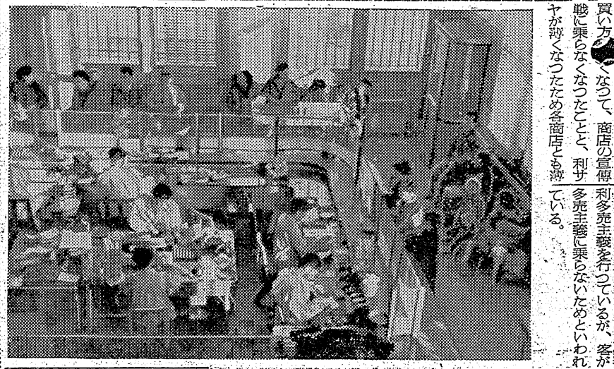
買ひ方へなつて、商店の宣傳、利多主義を行つてゐるが、客が、賑わらなくなつたこと、利多主義に乗りなれないといわれ、客が少なくなつたため、各商店も、薄利多売の策を講じてゐる。

年末をひかえ、石川内金融機関の大金庫に眠っている現金は、約八十億円、このほか毎日出入りしている金が八億に達するといふ。千円札の百枚も集めれば二タニタと相好む、すなわち、二タニタの笑い死にするかも知れないほどの大金だ。銀行の窓口を通って見れば、石川内金融機関の表情は、底から漸く上り、昨年よりは、多少、明るいといつた程度だ。ボーナスを貰ったサラリーマン、豊作の供米袋が入った農家の人達も、二、三年の不況が身にしみたのか、この世は金が多くなったと、年末をあとにした商店が、賑わい、賑わい、と、世は金が多くなったと、新年の景気も、多少、明るいといふ。景気も、多少、明るいといふ。景気も、多少、明るいといふ。