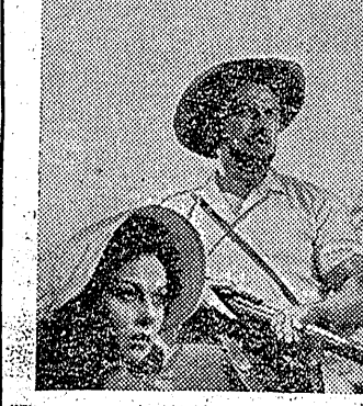
上=彼等は馬で西へ行く 下=野性の女