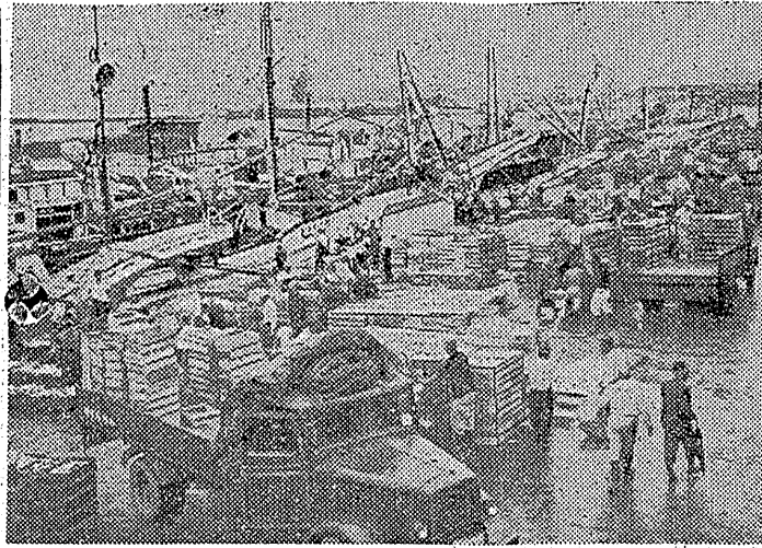
磐城市小浜漁市場は、このところ安値五十六円と連日十萬貫を超えて大漁が続いている。水揚げの盛況は、漁民の心を大いに鼓舞している。

磐城市小浜漁市場は、このところ安値五十六円と連日十萬貫を超えて大漁が続いている。水揚げの盛況は、漁民の心を大いに鼓舞している。連日十萬貫以上の水揚げを記録し、漁民の生活も安定している。