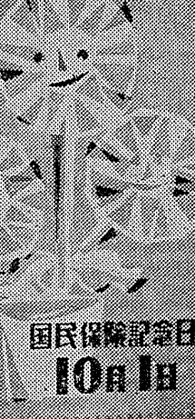
国民保険記念日 10月1日