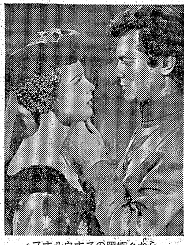
フォルウォオスの黒帽から