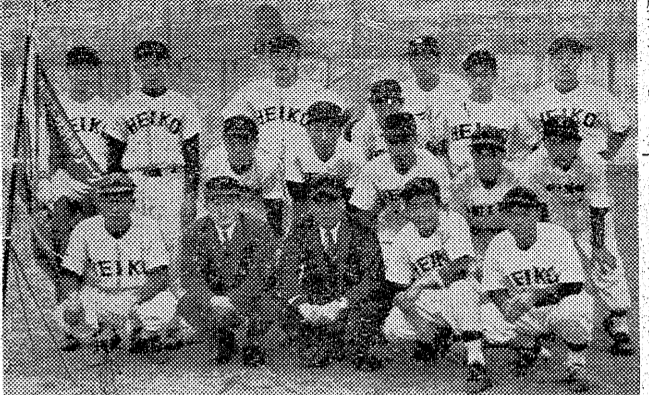
【写真】磐高(平工)の選手たち