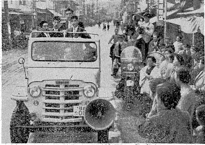
市内行進に声援の声