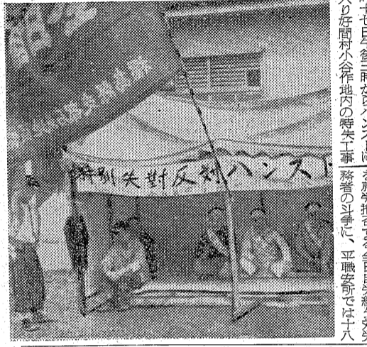
ハンストで事態收拾策を協議

ハンストで事態收拾策を協議 昨日午後三時からハンストに突入した労働者たちは、作業量の過重さを訴えている。労働組合は、この事態を收拾するために協議を行っている。労働者は、長時間労働による疲労と健康被害を訴えている。労働組合は、労働条件の改善を求め、労働時間の短縮を要求している。企業側は、生産性の向上とコスト削減を主張している。この問題は、労働者と企業の間で深刻な対立を生んでいる。