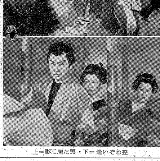
上=影に居た男、下=逢いぞめ笠

あす衛生会議 平、内閣、警備、勿来、五、はじむ。町町衛生課長、主任委員、十九日午前十時より平保健 あす衛生会議 平、内閣、警備、勿来、五、はじむ。町町衛生課長、主任委員、十九日午前十時より平保健