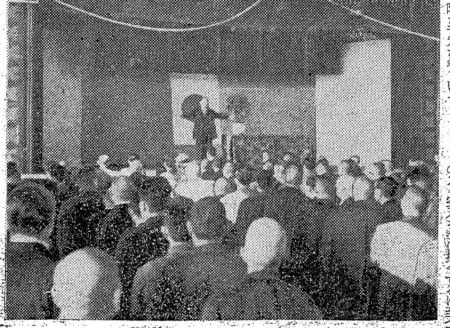
写真：赤井合併祝賀式

赤井合併祝賀式が挙行された。赤井町の合併を祝う祝賀式が、三月十日に挙行された。式には、町民の代表者や関係者が参加した。式では、合併の意義と今後の発展について話された。 赤井町の合併を祝う祝賀式が、三月十日に挙行された。式には、町民の代表者や関係者が参加した。式では、合併の意義と今後の発展について話された。