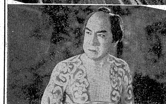
【写真は上からただいま零匹 攻撃 駐在所日記 はやぶさ奉行 右下は大当り三色娘】