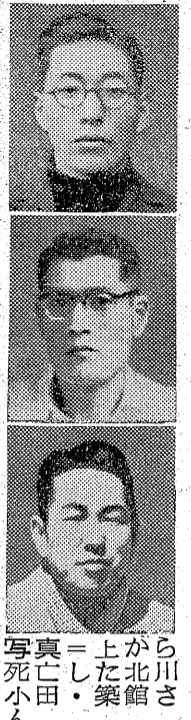
北川 上北館 真田 上北館 真田 上北館

常磐炭鉱鹿島坑(常磐市)第六坑連絡坑(坑口より地下二十五メートル)で三十一日午後十二時四十分ごろガスが爆発し、二名が即死、一名が重傷を負った。事故現場はガスの密度が〇・二%と異常に薄いといわれ、爆発の原因は今も不明。