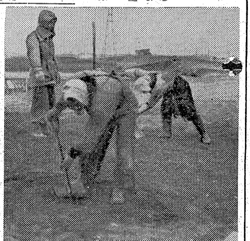
警城地区の養豚業者の設立準備会