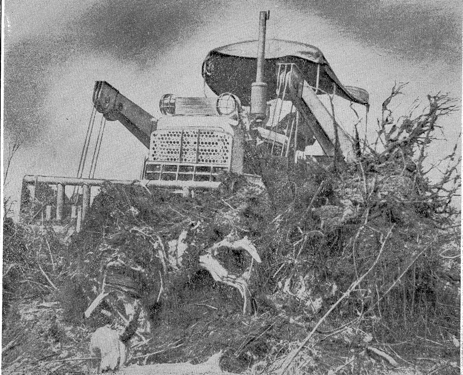
たくましいブルドーザーが合間にたまたま取り残されていた根っこが掘りおとされみえる岩地を露出させる