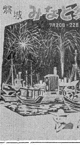
写真がえり上げた宣伝用ポスター。みなと祭りポスターでできる。

四倉町小中校 四倉町の農繁期休み。四倉町小中校。四倉町の農繁期休み。四倉町小中校。四倉町の農繁期休み。