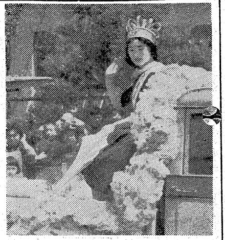
東京大会でも頑張つて！ ミス福島のパレード 三代市長らも激励

〇一九六〇年五日盛装パレードが開かれた。ミス・ユニバ... 三代市長らも激励... 東京大会でも頑張つて！