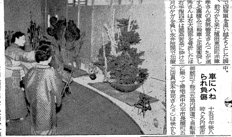
進行して来た福島市下三教育... 車にハねられ負傷