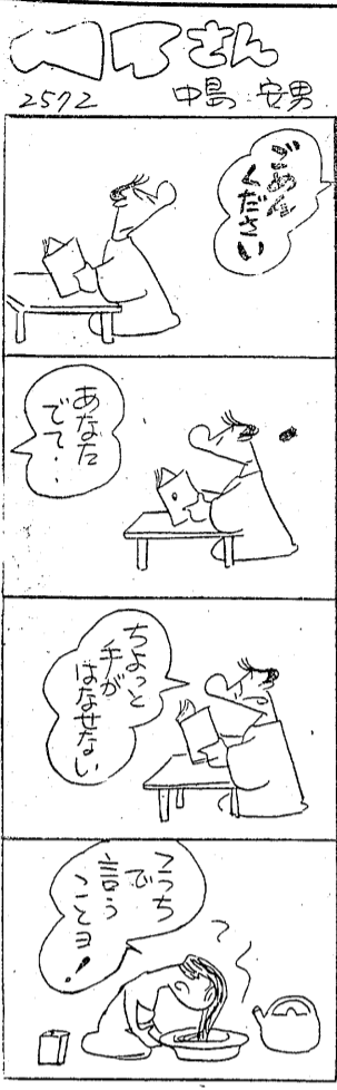
中島 安男 2572