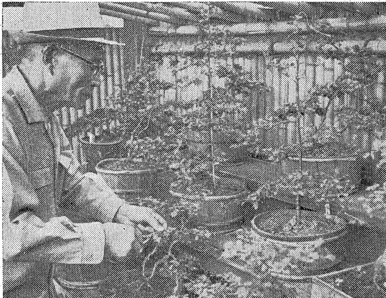
湖の畔花の園近く一枚の葉... 10月3日までは、紅葉の季節がまたか