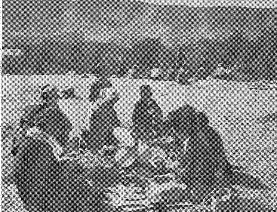
行楽のシーズン... みどりの山が日に日に赤黄に染まり、水石山の自然公園はまたか