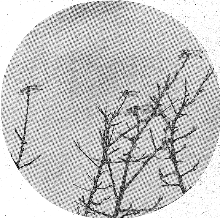
夕焼けの赤い空... 遠くには郷愁を呼ぶ赤い空が秋の情景曲をなしている