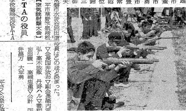
警備員が乗ったトラックが、歩行者と衝突した。歩行者は軽傷を負った。

母七歳病室入院中の外孫石松が、十一日午後六時水腫していた。救急隊が駆けつけ、処置を受けた。