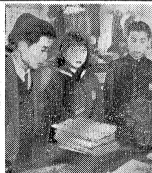
【平署に嘆願する好間小中生代表】

【平署】平署では、警察機動隊として活動しているが、三十三日(以下略)の好間小中生が嘆願(以下略)。