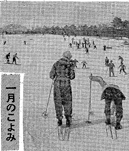
那須高原のスキー (去年撮影)