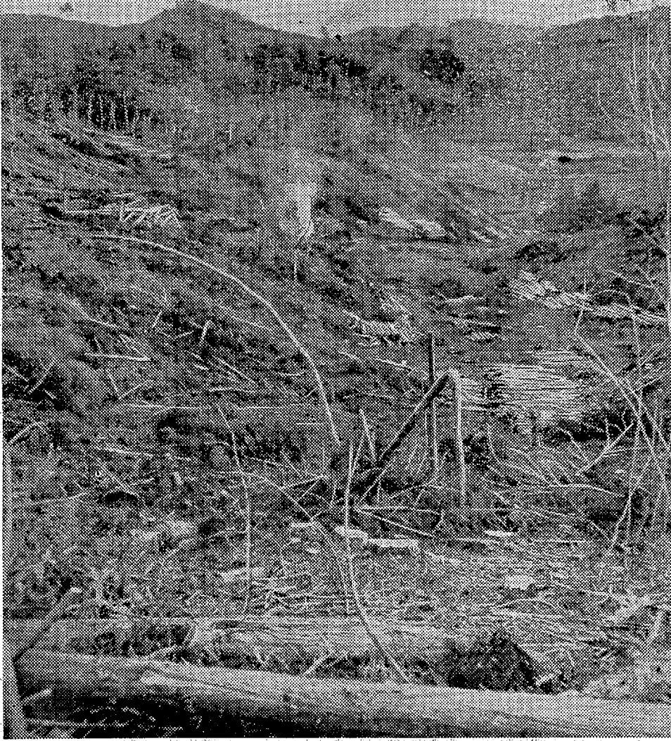
なまなましい木の香が 秋色にとけこんでた伐採現場は 戦場のようた

和村峠井沢事業所を離れて、三十四年八月から開始した同村差込事業所と合流させ、機械化する伐採、搬出に余力を上げています。今年度だけでも百二十万から六千六百二十五立方尺を伐り出す計画。 ○差込事業所には現在伐採用のチェーンソー、Y二七型小型集材機、Y二五型大型集材機がそれぞれ一台、フーカントラクターとアメリカ製ジープで搬出作業にフル