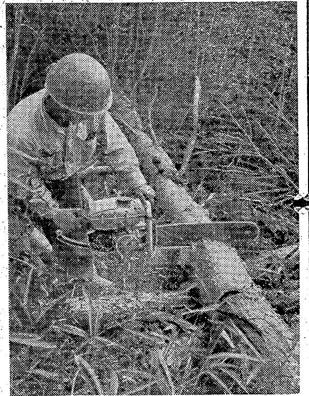
伐採 枝はらい すべて機械化で能率的に作業が運ぶ