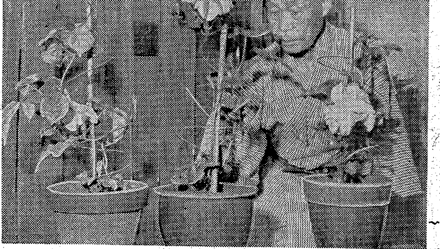
朝露に映くアサガオ