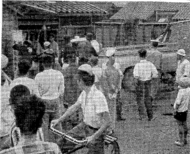
「家」に突っ込んだ小型トラック

内郷市商工会、同郷遊藝会が共催の夏まつり行事は盛大に催されているが、七日午後七時半から金坂グラウンドで第一回納涼演芸大会がいわき民報の協力で盛況に開かれた。雨模様の中、観客が詰めかけ、婦人会有志「内郷小唄」を皮切りに、花笠舞、秋田盆など全国各地の民謡を十二曲披露された。また十五日の盆踊り大会を前に模擬盆踊りも行なわれ、「内郷市の納涼演芸大会」