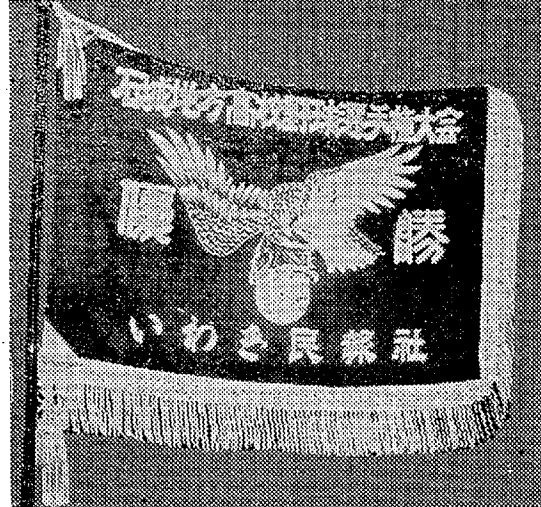
本社寄贈の白鷺旗

【平商球場】 平商一四倉 (一時三十分) 内郷一小名浜 (三時三十分) 【平市営球場】 平工一湯本 (一時三十分) 警城一勿来 (三時三十分) 地区シード制となる本社寄贈の白鷺旗かけて 湯本高など八校、興味ある試合 第一試合11日 第二試合12日 第三試合13日