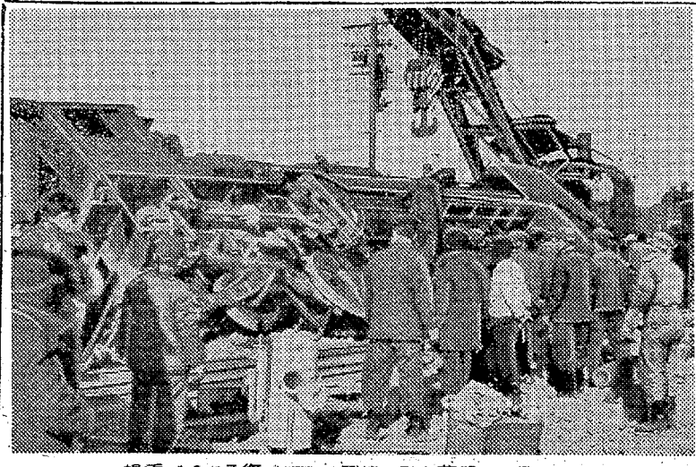
換重車による復旧作業。

脱線転覆した下り貨物九九九列車。普通貨物で、植田駅は無停車のたは新小岩発長崎行き四十四両編成の約四十七メートルのロットで十時五十分