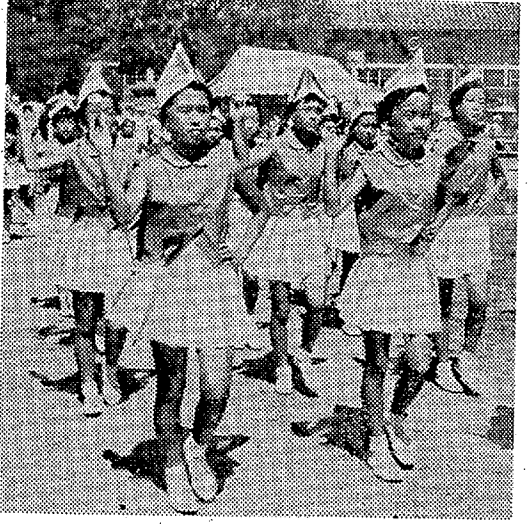
「ハントガールの出陣」

県水害対策本部は温泉を利用してウナギの「速成養殖」を試験中だったが、見事に成功した。ウナギの速成養殖は、温泉の豊富な土地柄には、注目されている。水質分析の結果はカルシウムが豊富で、ウナギの成長に有利である。また、温泉の温度も適当で、ウナギの成長を促進させることができる。ウナギの速成養殖は、県民の食生活に貢献するものと思われる。