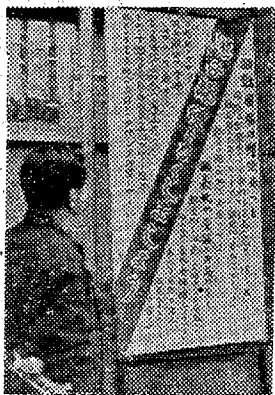
迷子郵便物は全国で一日平均二十万通に及ぶといわれ、平郵便局では迷子郵便物の立て看板が設置されている。

平郵便局では「迷子郵便物」を四月から六月までの三ヶ月間実施することになり、六月一日同局を境に迷子郵便物は全国で一日平均二十万通に及ぶといわれ、平郵便局では迷子郵便物の立て看板が設置されている。迷子郵便物の立て看板は、迷子郵便物の届先が不明な郵便物の届先を知らせるために設置されている。迷子郵便物の届先が不明な郵便物の届先を知らせるために設置されている。