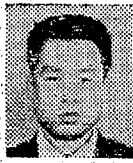
茨城、らしが逮捕してあり同人の犯行とみて追及している。余罪相当の疑いあり。

茨城、らしが逮捕してあり同人の犯行とみて追及している。余罪相当の疑いあり。茨城、らしが逮捕してあり同人の犯行とみて追及している。余罪相当の疑いあり。茨城、らしが逮捕してあり同人の犯行とみて追及している。余罪相当の疑いあり。