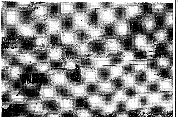
苦労と喜びを伝える記念碑は白鳥坂下に建てられた