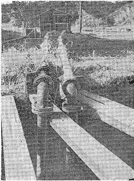
パイプで汲みあげて 一部は工業用水に使われている