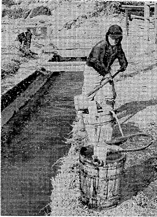
きれいな水を汲みあげ 豚舎清掃や 畑作用にも利用