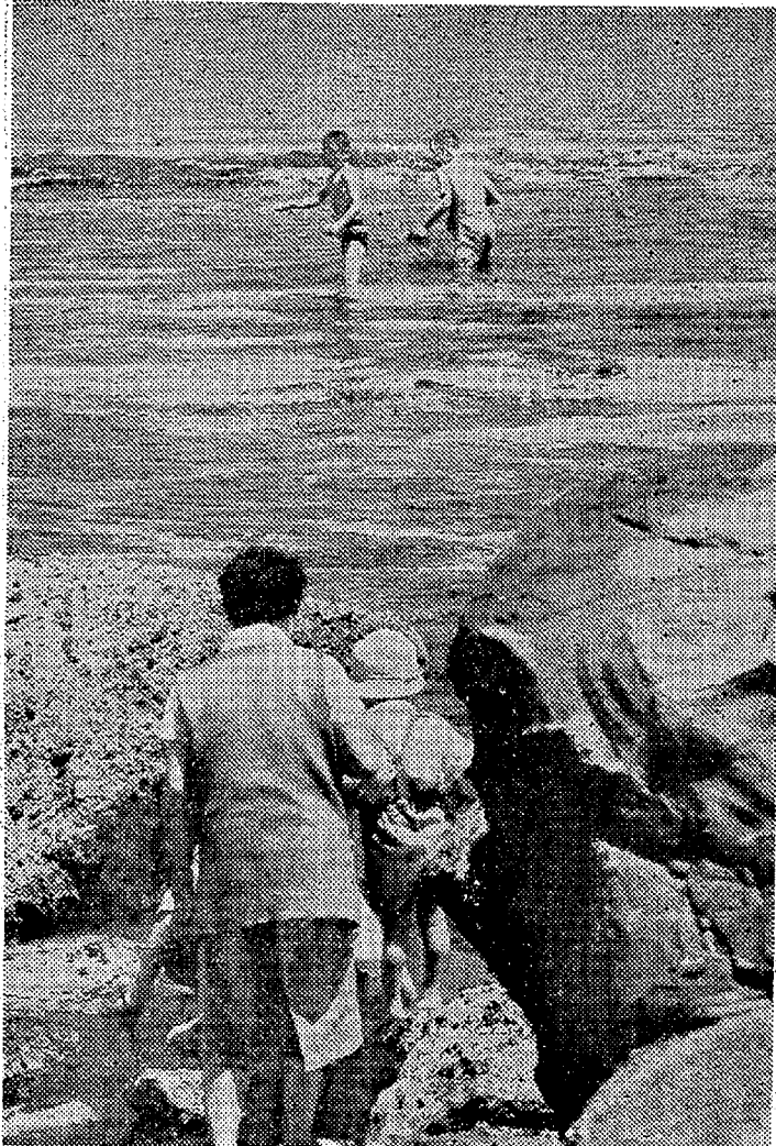
学習旅行で来た中通りの親子たちはオツカナピックリ磯づたい 地元の子は早くも海水浴(四倉)