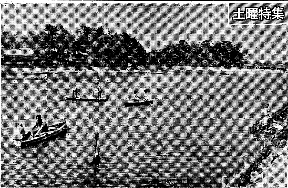
カーッと照りつける太陽のもとでボートやつりをたのしむ 空には入道雲も湧く(仁井田浦)

○二十一日からの夏休みを前に、久し振りの快晴に入道雲の湧くいわきの海は、海遊びをたのしむ人々で活気づいた。十六日の早の海開きをしながら、ななはまの浴客受け入れは準備が終わり、県内にキャパパン隊を繰りだして、早に乗りだしているが、小、中学生の夏休みをきかずに各海水浴場は、人