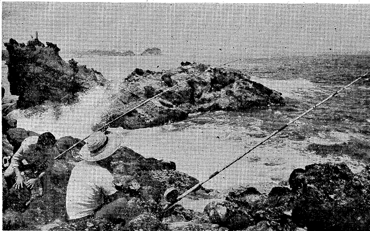
くだけ散るシブキをあびて そう快な海づりに涼を求める(波立薬師)

で押すだろう。○二十日は曇間灯台下にハングローができたので、勿来、久之浜と三万所、キャンプ場は新郷子と久之浜地区は整備されているが、このほか平の藤間海岸や、合橋の双気分浦にも格好の場所がある。黒潮が沿岸に近寄ってきたので水温もあがっているが、正体のつかめない小さい冷水塊が発生する心配もある。じゅうぶんな注意が必要といわれる。