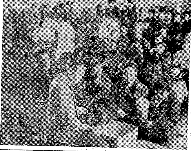
泣き笑い住宅抽選 市 四・四倍のはげしい競争...