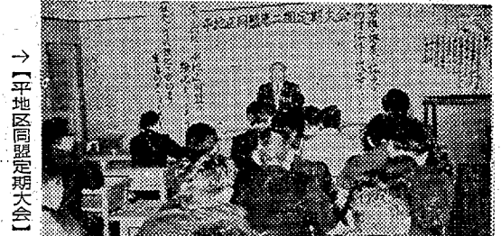
→[平地区同定定期大会]

富士電業の同業として進出が決まったいわき電子株式(志保)は、いわき市警署上野原合宿地区に進出することとなり、六月から操業を始めた。三千万計画で工場を建設するが、来春は従業員約三百人程度で、電子部品の生産に入り、四十四年度には五百人に達し、月産額も初年度の四千万から二億五千万円に達する。好調に進出が決まると、市警署に引続きの工場進出の準備に着手している。