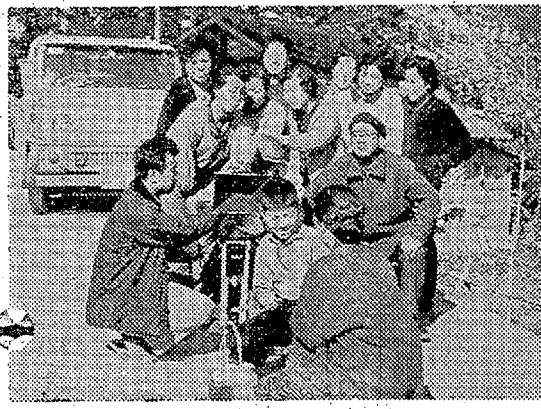
映画製作に協力するおおむらひたち

放浪 母親たちが学校へ抗議を申し入れ、母たちもまた、職員室で、海に身を投げた。秀代は、その中、秀代と同じ若き教師、海に身を投げた。秀代は、その中、秀代と同じ若き教師、海に身を投げた。秀代は、その中、秀代と同じ若き教師、海に身を投げた。