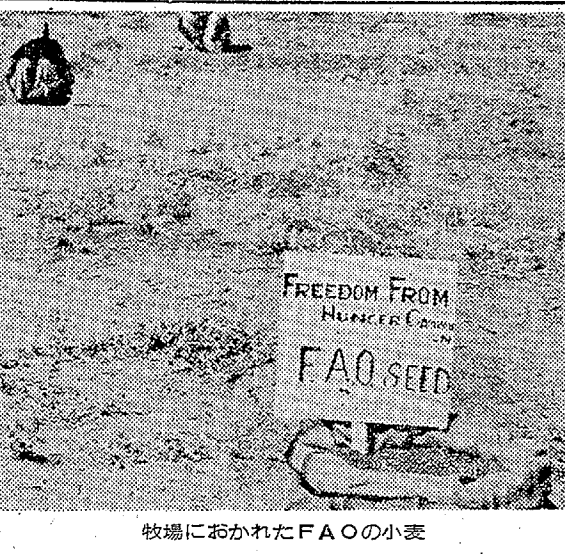
牧場におかれたFAOの小麦

笹とネズミ ◇ 趣味の手帳 昔から、ササは六十年に一度花 が咲き、実を結んで枯れるといわ れている。民間「金津路橋」の 一節「ササに黄金が、またならさ がる」とは、咲いたササの花 が、金山二ヶに咲いたササの花 を歌ったものである。またササの実 は、栄養価も非常に高く、小麦に ほぼ匹敵するといわれている。落