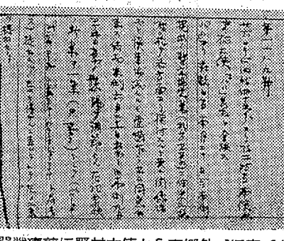
開戦直前に野村大使から東郷外相に宛てた電文

星の物語。星の物語は、大正十二年、エーベルト大尉の物語です。星の物語は、大正十二年、エーベルト大尉の物語です。星の物語は、大正十二年、エーベルト大尉の物語です。