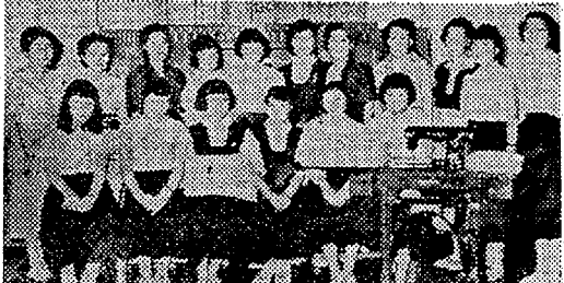
△家庭科施設△三十二年六月、給養室の改修工事完了。...