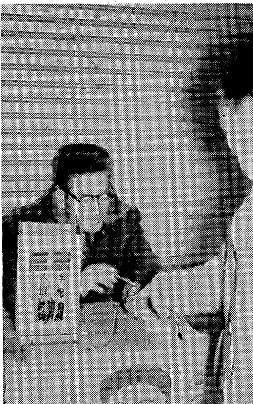
松竹ボーリング場のクリスマス大会の様子

家庭のドラマ 岩貯蔵は違反 消防本部が警告 火災シーンを迎えていわき市消防本部は二十五日、少歳危険物貯蔵違反を指摘し、警告状を出した。