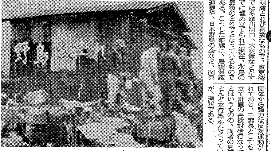
現代の映像—地元の人々は野鳥保護、都市開発をさまたげたいと考える愛鳥家たちと対立する

みもの 現代の映像 人か鳥か 自然は今、埋立て、宅地造成、観光開発、公害などにより、次々と破壊されておられる。自然の破壊が近代化、文明化の指図である。