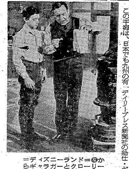
少年事件記者の取材風景

少年事件記者 ギャラガー この野鳥の天国に、去る三十五年から、京葉工業地帯の造成が始まり、地下鉄の新駅も始まってきた。