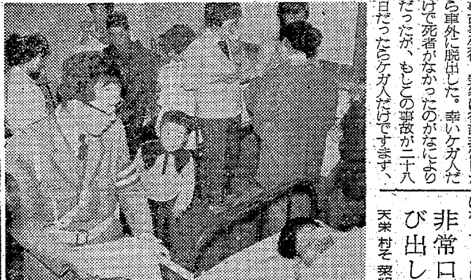
乗客55人が重軽傷を負った観光バスが、常磐川に転落した。乗客は重軽傷を負った。