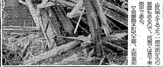
乗客55人が重軽傷を負った観光バスが、常磐川に転落した。乗客は重軽傷を負った。