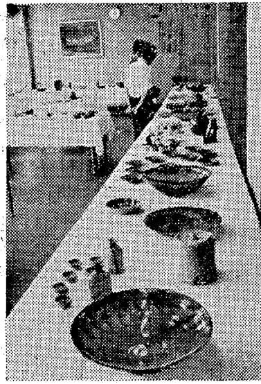
雷電の伝導路は、雷電の伝導路の先端部で放電される。雷電の伝導路は、雷電の伝導路の先端部で放電される。

毎年雷雨によって多数の死者を出している。雷電の伝導路は、雷電の伝導路の先端部で放電される。雷電の伝導路は、雷電の伝導路の先端部で放電される。