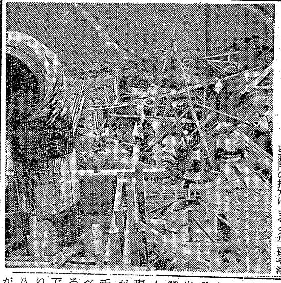
「浄水場近くでの配管工事」

磐城、常磐地域の工場向けに工業用水や上水の給水線となつてゐるいわき市用水道は、高梁ダムを含めて二十三億四千八百円を投じて三十七年十月一日完成、一日三万三千四百トンの給水を開始したが、その後工場等の進出などによって給水量が増加し、本年六月には二倍以上の七万三千トンの給水が必要となつた。四十五年には十萬九千六百トンの給水が必要となる見込みで、給水不足の恐れがある。第二期配水線工事の着手した。第一期配水線に並行して、五百六十メートルの鋼管を延長四千五百三十三・五メートルを布設、常磐地区へ一万吨増の二万七千トンを給水する。