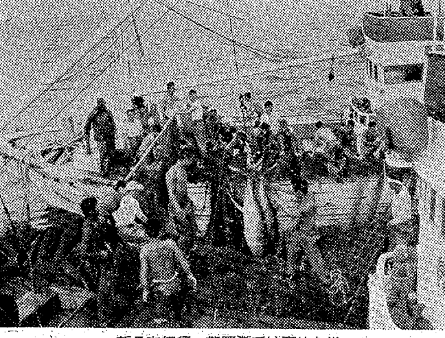
◇新日本紀行「熊野灘」では豪快な巻 取網漁でマグロがつかうきにとれる

みもの ◇新日本紀行 総合・夜7・30 熊野など この地方は、「伊勢志摩」と新 歌山県「新宮」を「勝浦」を中心 とした南紀の有名な観光地と よって中間に位置し、国鉄の紀勢 線、紀伊半島連絡線、観光客 も、とくくすおもしろいところ である。しかし、それだけにこの地方 は、また荒れさらされていない良 富み、豊かな土地の人々の人情と あいまって、のんびりと釣り糸を 垂れ休日を楽しんでいる。この地 方面のサリアンによって、絶 好の保養地となる可能性を秘めた 土地柄である。