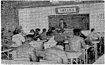
自営者教育で講師を務める市平市平字川田町水産会館(前)後継者(左)一