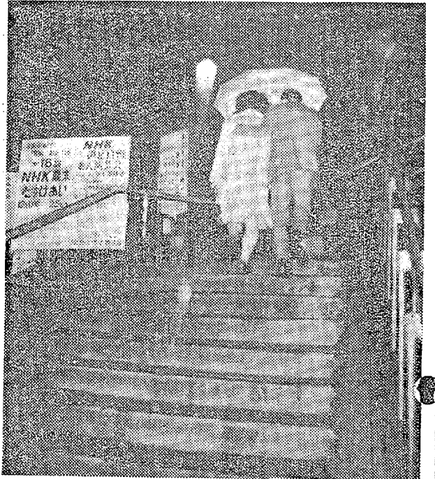
待望のボーナス支給日に雨にたたられて、なげきのサラリーマンだったが、農家には恵みの雨だった(5日夜6時 平 平安橋)