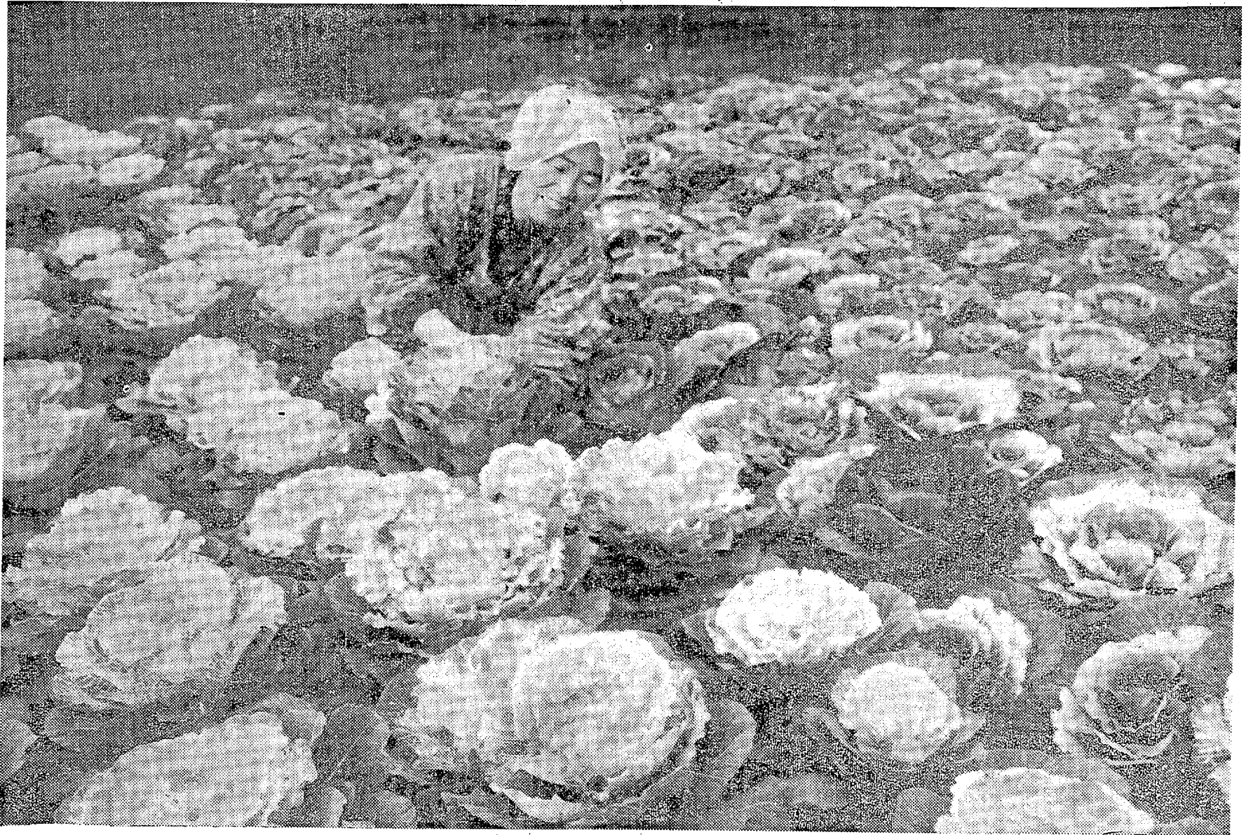
やっと生野菜取りもじつ正月用の葉ボタン(白菜)も冬野菜のブチが目に入り、虫のついたのも多いところ。白菜よりも赤色の方が売れ行きが良かった(平 中神谷)