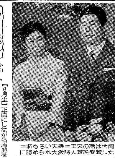
「おもしろい夫婦」正夫の話は世間 に認められ大賞を受賞した

あすの運命 七月二十五日(木・先勝) 【1月生】一時の同情が恨みの女 性なることあり、自取すべし 【2月生】わずかなことから感情 に走りやすい、控えめが安全 【3月生】目的達成には自分の力 だけで困難、周囲の力借りよ 【4月生】制の合い思いとおりに 進んで多し、大欲出せば自滅 【5月生】なんとなく心の落ちつ かぬてあつ、あせらぬが難題