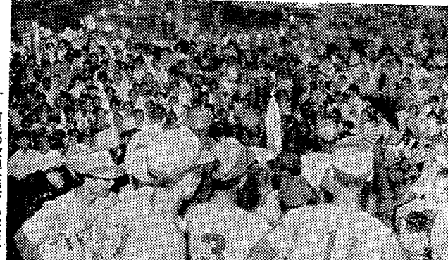
平駅頭で選手歓迎会。よくやったと拍手の波が起きた。

東京オリンピックの入場式は、平駅頭で選手歓迎会が行われた。よくやったと拍手の波が起きた。よくやったと拍手の波が起きた。