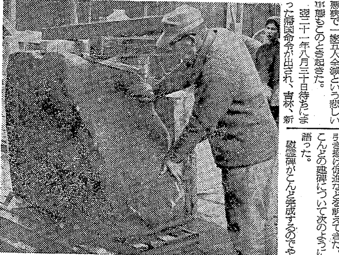
平不順な天候予想。いわき市平支所と同済民防除団は、全農家に防除しおりを配布している。

平不順な天候予想。いわき市平支所と同済民防除団は、全農家に防除しおりを配布している。防除しおりは、農作物の防除に役立つ。平不順な天候予想により、農作物の被害が拡大している。