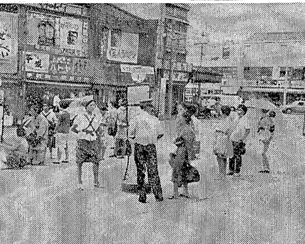
調査に協力している農家の主婦たち。