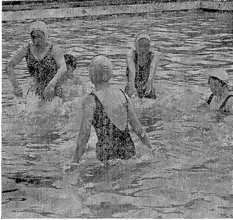
始め冷たさにちゅうちよしていた女の先生も つきつきとプールにとび込み 冷たさも忘れて浮き方から熱心に学んでいた