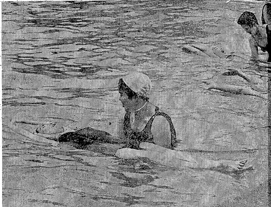
初心者には、面かぶりばた足とバックからはいる場合がある 普通面かぶりばた足は男子がはいりやすく 女子はバックからはいりやすいとされている