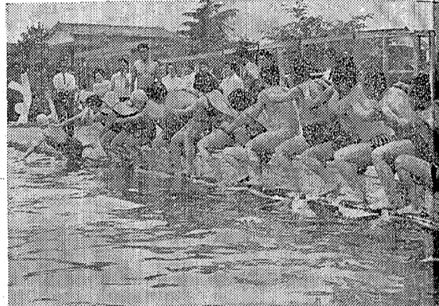
泳げることはもっとも大切だが その前に水になれることが必要 浴びをさせて 能力の同じものを組ませるパティシステムをとら

小、内郷二中、警備体育センタ、興化学アールの四支会に分けて実施された。これは小中校の教材に水泳を取り入れられたのを機に、三年前から児童・生徒に段階別な泳法指導ができる先生の育成のためのものである。いまでは泳法指導できる先生が少なく遊歩プールだったが、これからは次々として泳法指導の未熟防止にもつとめる。〇：四会場で二百人の参加があり、そのうちかなづち先生が三〇名を指導している。あつて、講師の先生も講習をうけた先生たちも水の冷たさを覚えてプールに飛び込み、女の先生の参加者も五〇％以上を占める。毎年の水泳に対する関心が高まってきている。