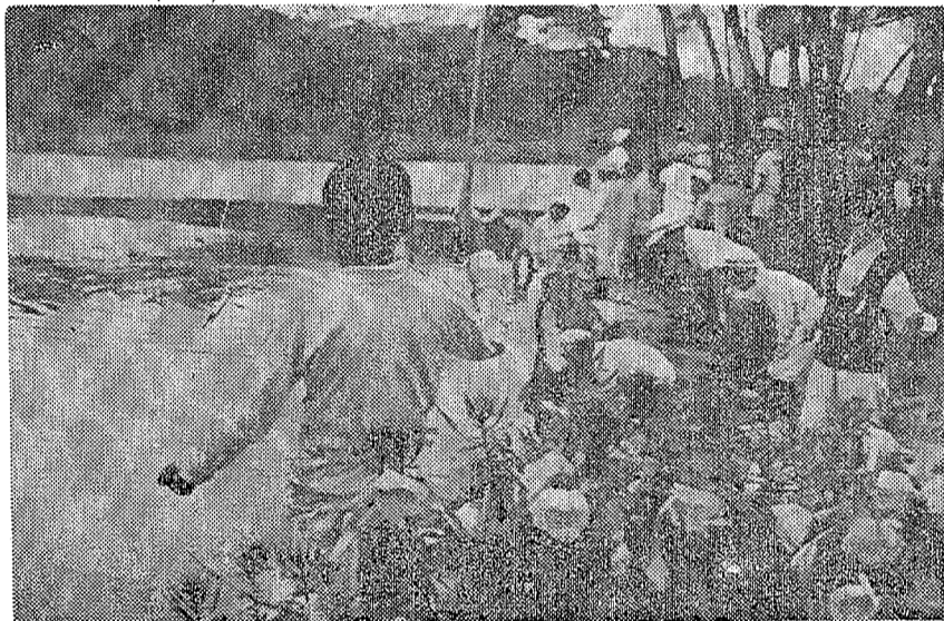
月見草咲く藤間沼で魚釣り 遊びの中から危険箇所や人に迷惑をかけない 初歩的な集団生活のルールが教えられる