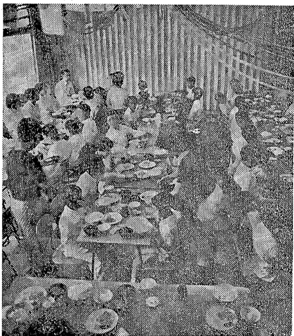
食事はセルフサービス 食事のマナーを学び 食べたあとは皿洗いですなど 自我の許されない規律ある生活態度を身につけた

〇十九日は朝六時に起床、霧のたごめた海岸まで歩いて、リレー、実習のあと、七時半に朝食をすませ、八時半に、砂の芸術、部員や電の子づらに先生方二階、三階、つしよ。十時に横川、地引網に陣じ、昼食、昼寝のあと、あしづけもじつからすませて反省会、午後四時一泊百舎の訓練を無事終った。