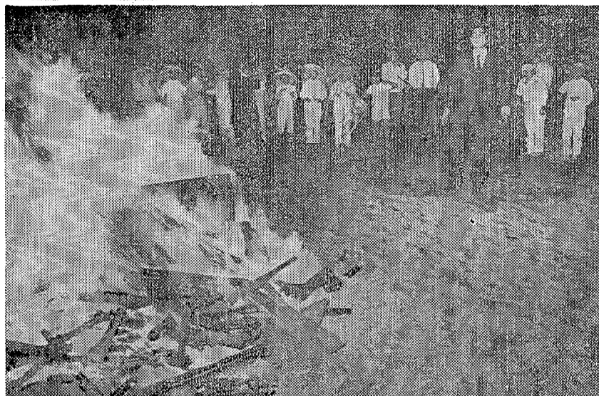
中央のたき火を囲んで円陣体型 ジャンボリーで気分をほぐしてからグループごとの歌 土人の踊りなど20種目に夜の更けるのも忘れたよう