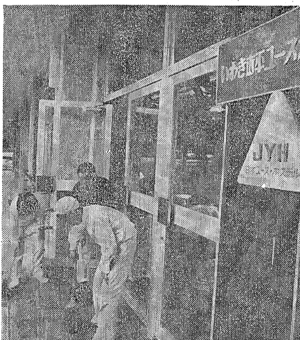
とかく過保護になりがちな家庭生活でも 集団生活では清掃も自分たちの手できれいに...