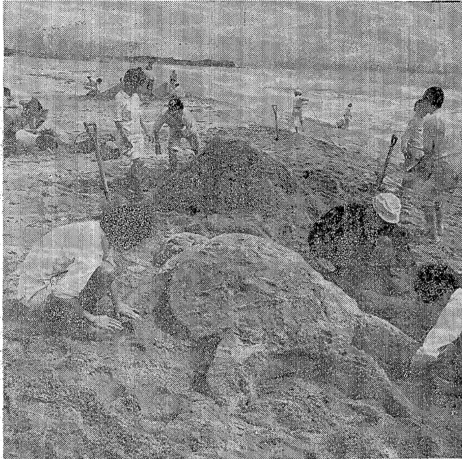
子どもと一緒に泥まみれになれる教師が 知恵おくれの子どもをほぐくみ育てていくといわれているが 砂浜で「芸術づくり」に先生も生徒と無心の境地